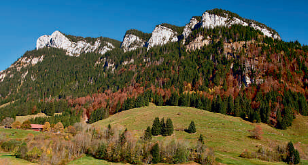
Schwändeliflue et ses formes caractéristiques

Les débuts ont été difficiles. La création du syndicat n'a pas abouti immédiatement et a nécessité de longues années de discussions et de persévérance. Les premières coupes de bois étaient à peine terminées que l'ouragan «Lothar» s'est abattu sur le pays. Les membres