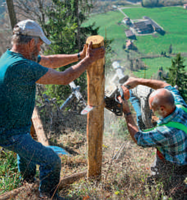
Construction de trépieds en bois