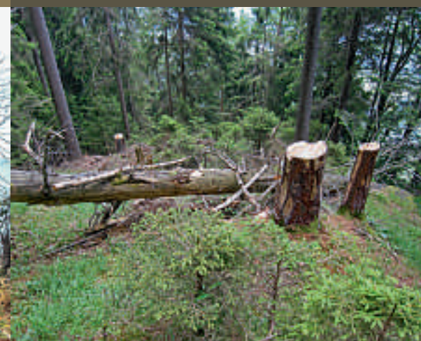
Soins à la forêt protectrice

Les résultats positifs, atteints jusqu'ici par petites étapes, montrent que le syndicat d'entretien des forêts se trouve sur la bonne voie.