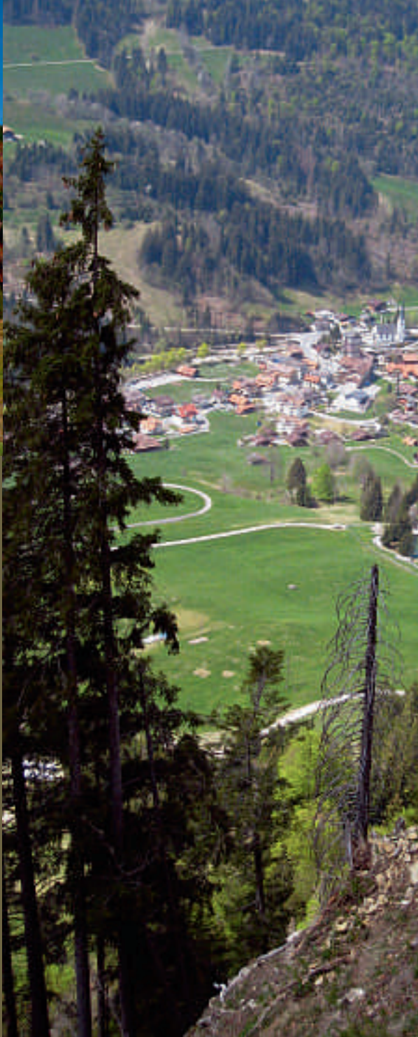
Vue du Dossenmätteli sur Flühli

Le Syndicat d'entretien des forêts Schwändeliflue a su prendre les risques qu'il fallait pour le bien du village de Flühli. Il constitue par conséquent un modèle de réussite pour la forêt privée.