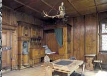
<Sanft aktualisiert: So präsentiert sich eine Stube aus dem Schloss Wiggen (um 1582) heute im Landesmuseum Zürich.