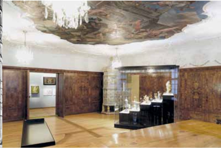
^Das Schaffhauser Museum zu Allerheiligen integriert in den Saal aus dem Zunfthaus der Gerber (1734) eine Vitrine mit dem Zunftsilber.